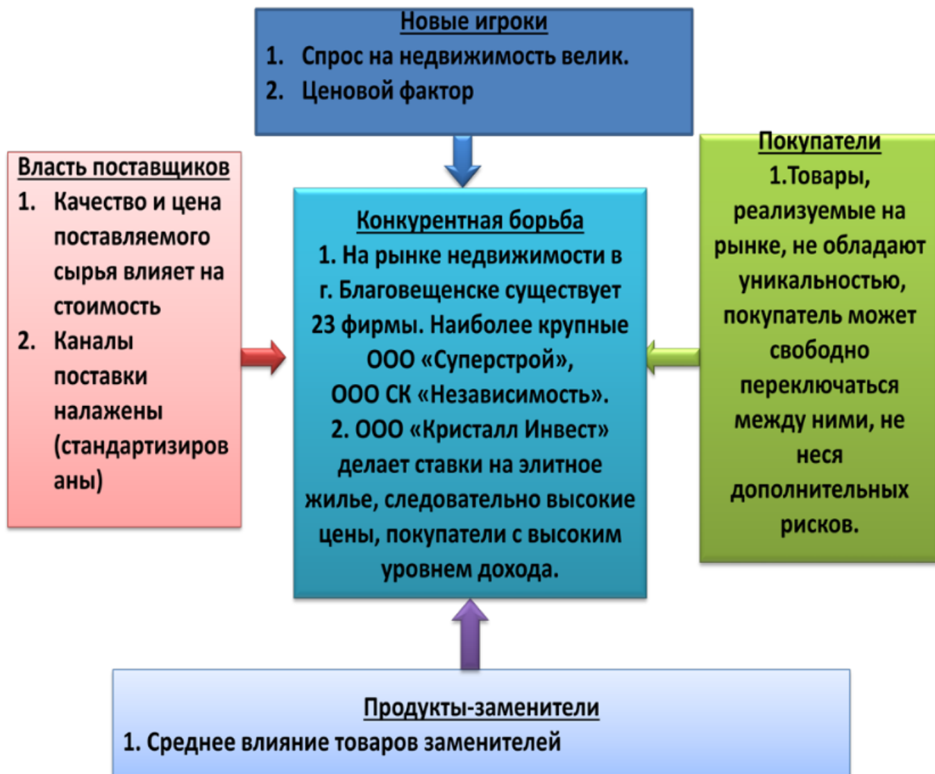
Рисунок 3 - Модель конкуренции пяти сил М. Портера для ООО