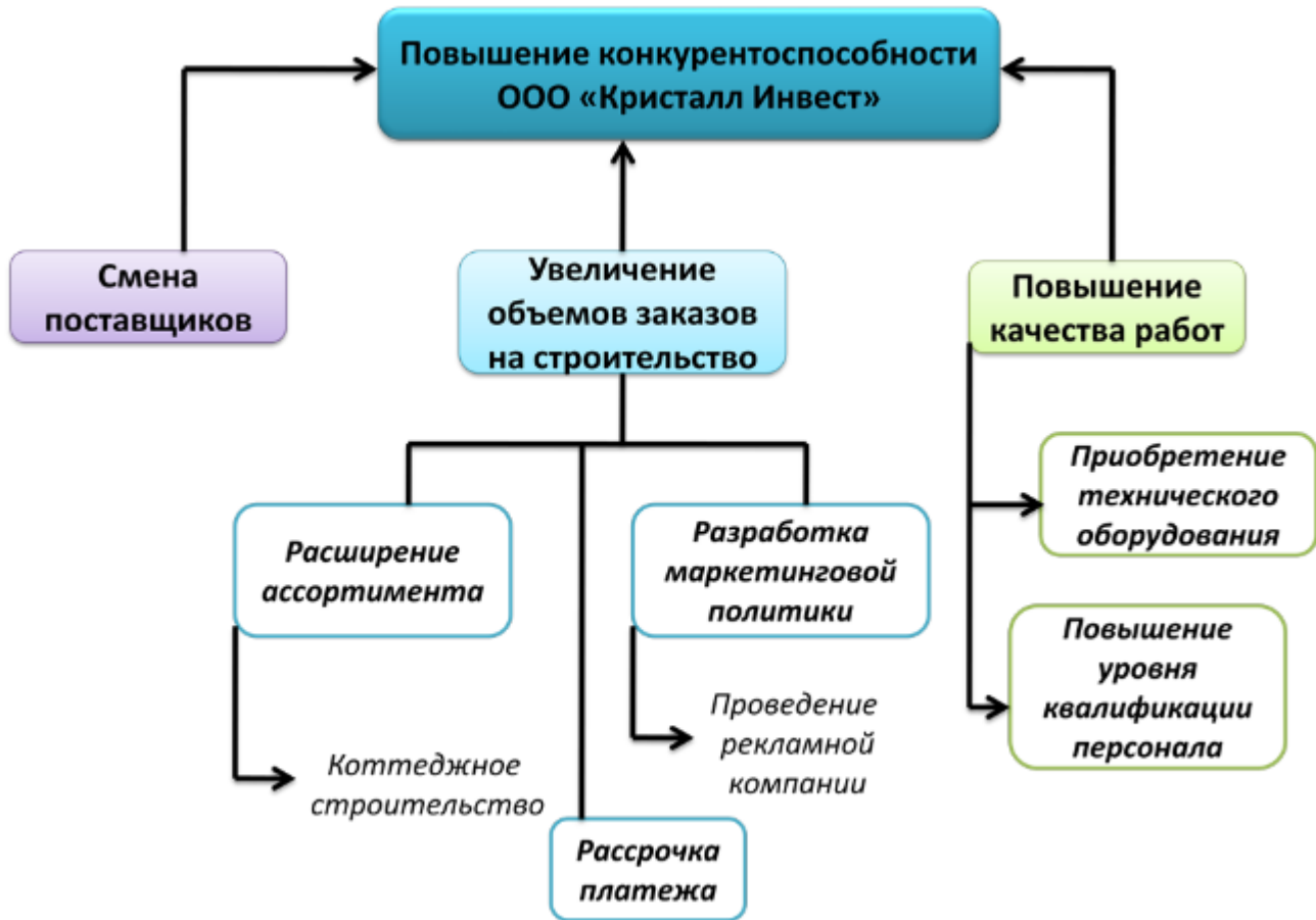
Рисунок 4 - Предлагаемые мероприятия по повышению конкурентоспособности ООО «Кристалл Инвест»

роста конкурентоспособности и финансовой устойчивости компании. Для этого проанализируем основные материалы, требующиеся для строительства и закупочные цены на них (таблица 9).